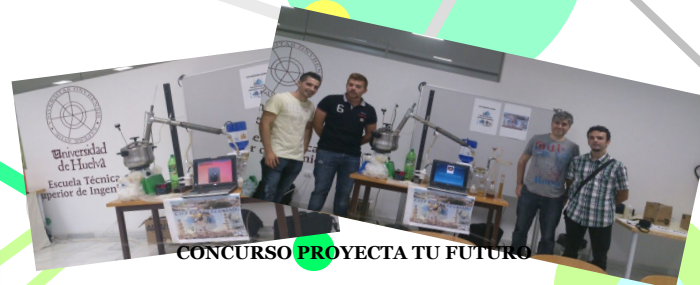
CONCURSO PROYECTA TU FUTURO