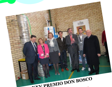
XXV PREMIO DON BOSCO